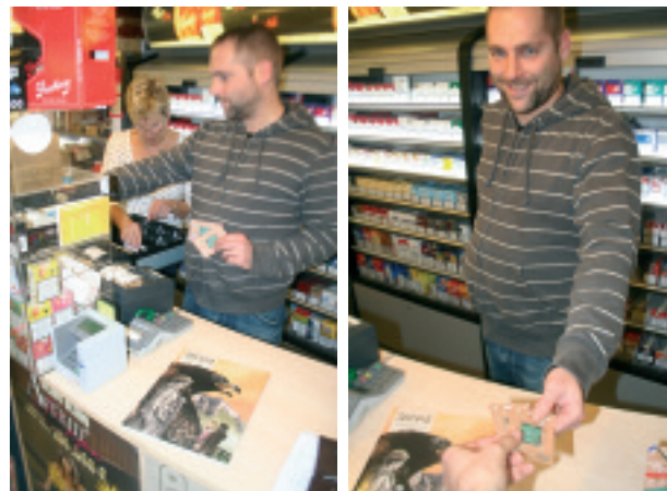
Une bande dessinée de Servais achetée en épis.