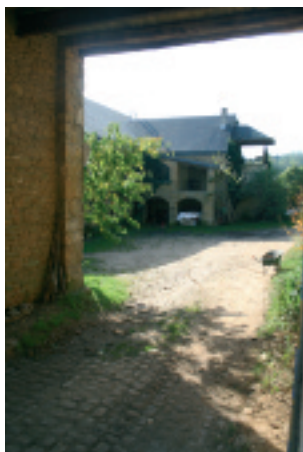
La chèvrière du Hayon, bienvenue au paradis.

En redescendant sur le village de Meix, nous risquons une petite visite à la chèvrière du Hayon, à Sommethonne – voir votre Valériane n°104. Là aussi, comme l'indique l'affichette sur la porte du petit magasin, les épis sont acceptés. Mais le lieu, paradisiaque, est désert. Ce n'est pas une heure pour tenir boutique... La ferme du Hayon est très liée au projet de