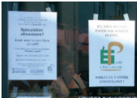
La boucherie Romain à Florenville.

sympas que les euros, malgré leur équivalence. Il y a quelque chose de plus humain dans cette monnaie. Nous avons rencontré les personnes qui portent le projet, nous connaissons les objectifs, nous savons