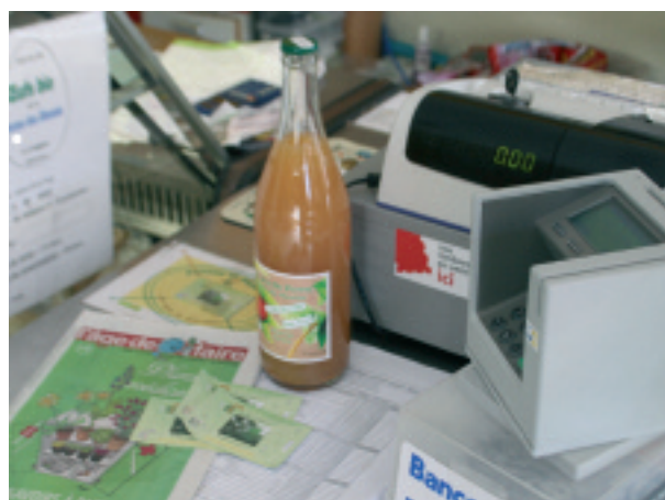
Paiement en épis chez Dame Nature.

dans des alternatives n'ont jamais la garantie d'un résultat sensationnel et immédiat. Est-ce une raison pour ne rien faire ? En tout cas, je quitte la Gaume impressionné par le dynamisme de ses villages et l'accueil des personnes rencontrées. Pas « bobos » pour un sou. Je dépense mes quatre derniers épis pour un litre de jus de pommes et un exemplaire de L'Âge de Faire . Un très beau nom pour un journal.