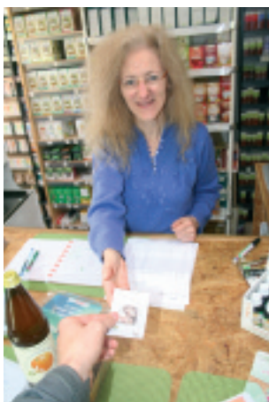
Paiement en épis chez Dame Nature.

L'aventure commence chez Dame Nature , un petit magasin de diététique sur la place de Florenville. Concentré de parfums d'herbes aromatiques, d'épices diverses, Dame Nature fait office de comptoir de change, c'est-à-dire un lieu où l'on peut se procurer des épis. Passage obligé pour moi qui n'ai que des euros en poche. Le change s'avère être une opération toute simple. Trente euros égale trente épis, sans autre for-